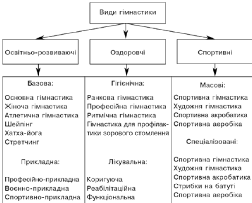
Рис. 2.1. Класифікація видів гімнастики

У залежності від головних завдань, що вирішуються фізичним вихованням, виділяються види гімнастики різної спрямованості. Найпопулярніші з них наведені на схемі 1.